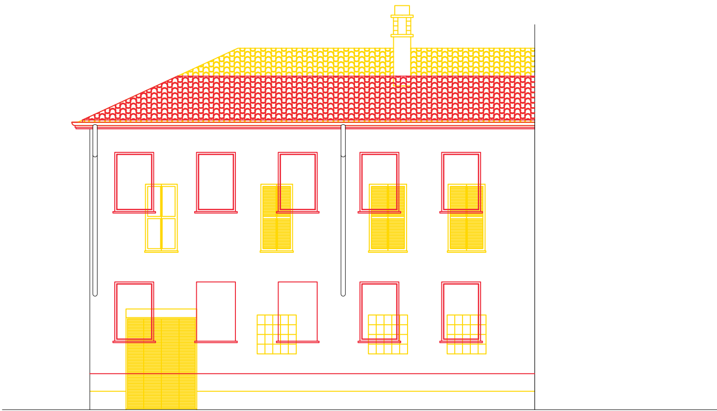
PROSPETTO SU VIA ZONCADA